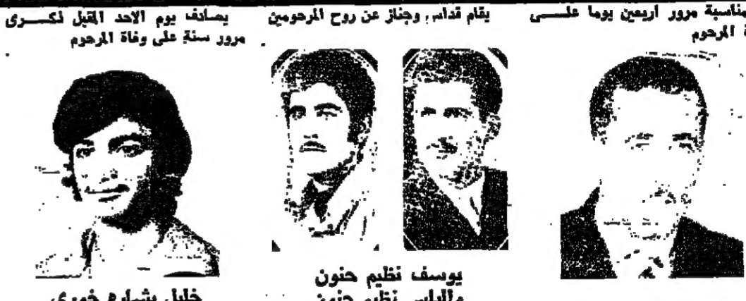
بنسبة مرور سنة على وفاة المرحوم